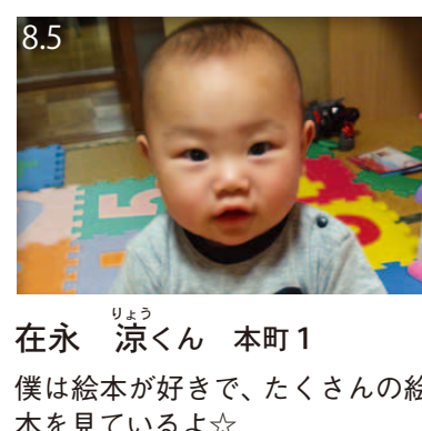
8.5 在永 涼くん 本町1 僕は絵本が好きで、たくさんの絵本を見ているよ☆