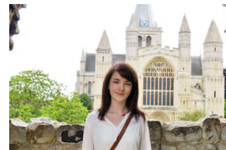
ロチェスター大聖堂の前にて