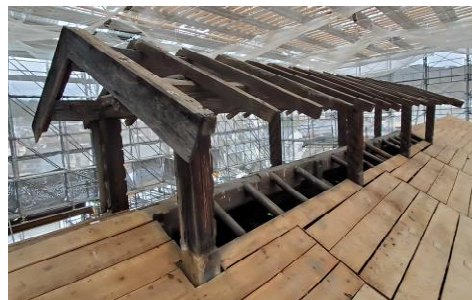
▲野地板解体後の太鼓櫓と骨組みとなった越屋根の様子