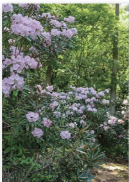
今年の花見は泉谷で

御祓地区の「泉谷の棚田」周辺に植栽した約2000本のシヤクナゲが、4月下旬に見頃を迎えます。無料送迎バスを運行するので、ぜひお越しください。