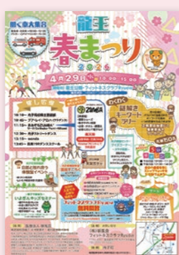
イベントのポスター