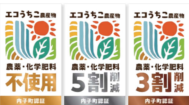
新しい認証シール。削減量が一目で分かるデザインに

○安心・安全で環境にやさしい商品の目印 「エコうちこ農産物」認証シールをリニューアル 内子町では、化学肥料や農薬の使用を減らして栽培した農産物を「特別栽培農産物」(エコうちこ農産物)として認証しています。 認証を受けたことを示す「認証シール」が、4月出荷分から新しくなりました。シール付きの農産物は、道の駅内子フレッシュパークからの直売所などで販売しています。