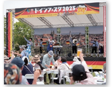
ドイツ気分で盛り上がりよう