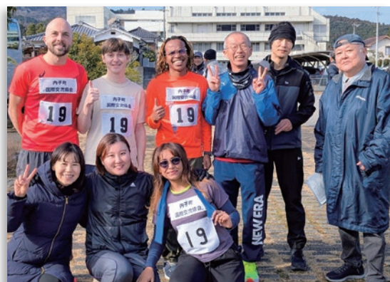
スタート前のランナーと応援団の皆さん