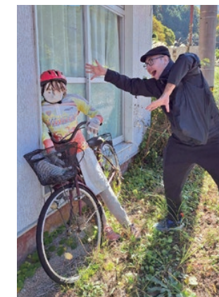
「かかしの里」で撮影した一枚