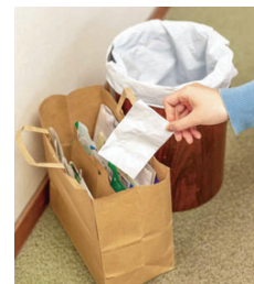
小さな紙類は紙袋にまとめ、口を縛って出しましょう

※分別方法など、詳細はホームページでご確認ください。 ID 130755 【問い合わせ】 環境政策室 0893(44)6159