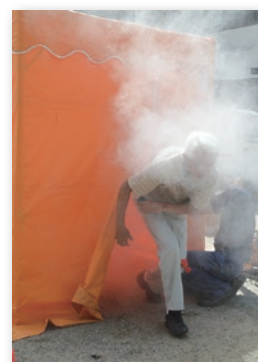
煙体験ハウスの様子

●日時 12月7日(日)午前10時～ ●場所 城の台公園 ●内容 避難所体験、土のう積み体験、煙体験ハウス、車両・防災備蓄品の展示、非常食の試食 他