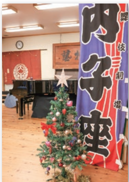
楽屋がコンサート会場に

特別公開中の内子座楽屋でクリスマスコンサートを開きます。 ●日時 12月21日(日)午後1時30分(30分程度) ●場所 内子座楽屋