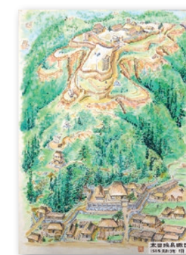
鳥観図（発掘調査報告書より）

城の台公園で約30年前に行われた発掘調査で、室町～戦国時代の山城が発見され、多数の遺物が出土しています。今回は愛媛大学と連携して、当時の発掘成果を深掘りする「太田城再評価プロジェクト」を実施します。約500年前の小田地域の暮らしに触れてみませんか。