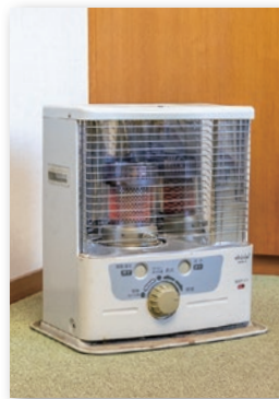
火の取り扱いに注意を

冬場は石油ストーブやファンヒーターなどの暖房器具が原因となる火災が増える時期です。安全な使い方をもう一度確認しましょう。