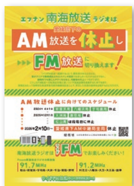
12月からは「ワイドFM」で