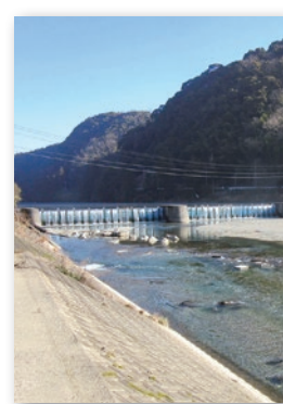
堰上げをした龍宮堰

堰上げの開始後は、川の流れをせき止めることで上流の水位が上昇します。危険なので川に近づかないでください。