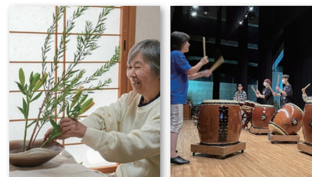
新しい趣味を見つけて、会員との交流を楽しみませんか

内子町教育委員会 自治・学習課 生涯学習係（内子分庁内） ☎0893（44）2114