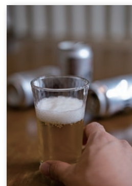
改善の糸口を見つけよう