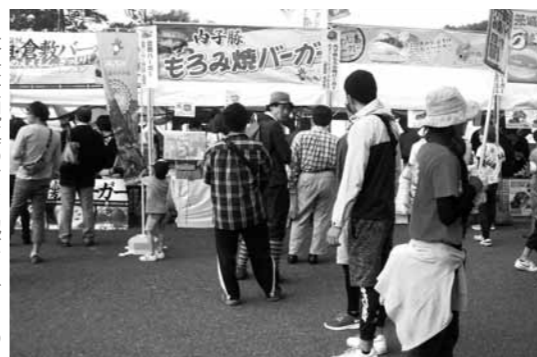
日本最大規模のご当地バーガーの祭典。2日間で約4万人が来場

国から37種類のバーガーが出品され、内子豚もろみ焼バーガーは、「味噌のうまみがほどよい」完成度が高い」などの評価を得て、総合16位と健闘しました。一位には、別海ジャンボホタテバーガー(北海道)が選ばれました。