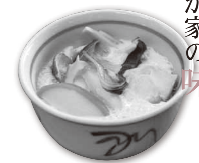
茶わん蒸し (1人分 85 kcal)