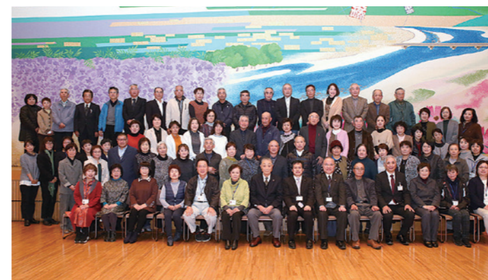
委嘱状の伝達式に出席した関係者の皆さん