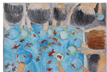
『いかざき金魚すくい』 成見 璃琥さん(天神小4年)