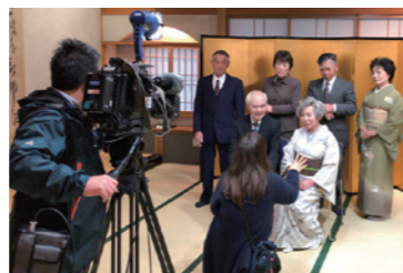
30年度の金婚祝賀会の様子。人生の節目にすてきな思い出をつくりませんか