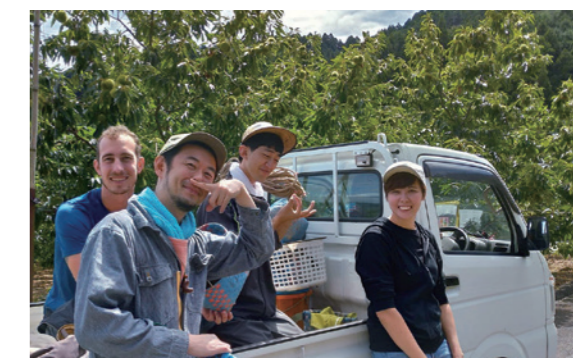
昨年実施した栗農家のボランティアツアー

※受け入れを申し込んだ農家には4月から12月の間、農作業に合わせて随時派遣する予定です。ただし、ボランティアを公募するため、派遣を確約するものではありません。