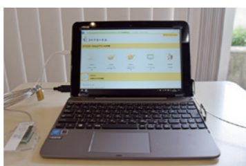
◀本庁に設置しているマイナポータルの端末

け渡した履歴を確認できます。 Q マイナンバーカードの申請中に転出することになりました。何か手続きは必要ですか A 申請中に他市町村へ転出すると、申請が無効になります。転出先で新たに申請する必要があります。内子町内での転居の場合は、手続きは必要ありません。 Q カードに期限はありますか A 20歳未満の人はカード発行から5回目、20歳以上の人は10回目の誕生日までが有効期限です。ただしカードに搭載された電子証明書は、発行日から5回目の誕生日で有効期限が切れます。