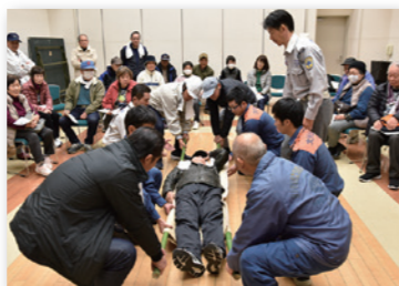
小田地区の防災訓練の様子