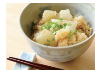
季節の一皿 SPECIAL DISH