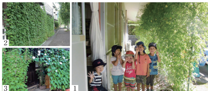
1_ 最優秀賞の石畳へき地保育園。大きく育った緑のカーテンにっこり 2_ 優秀賞の内子町図書情報館 3_ 同じく優秀賞の床屋市兼

しました。最優秀賞に輝いた石畳へき地保育園の保育士は、「葉が密集するように、間隔を狭くして種を植える工夫をした。毎日欠かさず水やりを続けるなど、園児たちが頑張ってくれたおかげ」と喜びました。