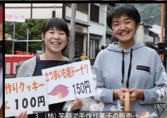
3_ (柿) 笑顔で手作り菓子の販売