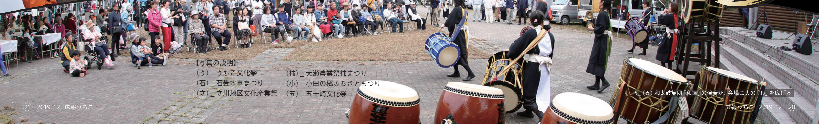
【写真の説明】 (う) _うちこ文化祭 (柿) _大瀬農業祭柿まつり (石) _石畳水車まつり (小) _小田の郷ふるさとまつり (立) _立川地区文化産業祭 (五) _五十崎文化祭