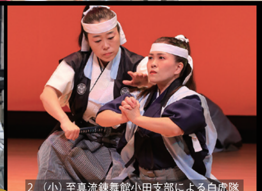
2_ (小) 至真流錬舞館小田支部による白虎隊