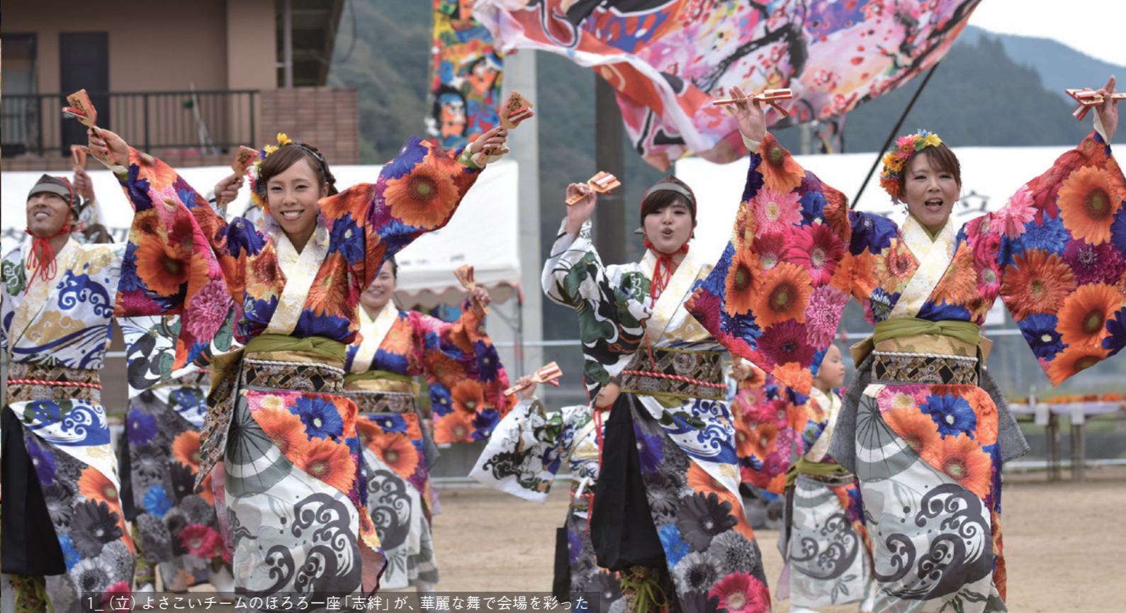
1_ (立) よさこいチームのほろろ一座「志絆」が、華麗な舞で会場を彩った