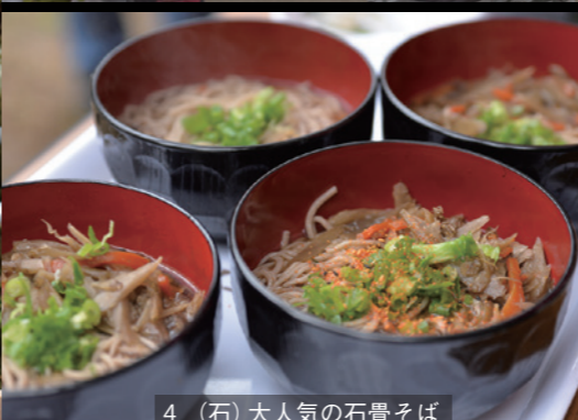
4_ (石) 大人気の石畳そば