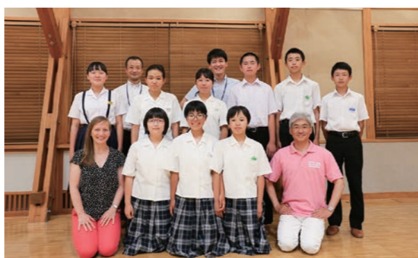
第25回青少年海外派遣事業派遣団の皆さん

派遣団員は現在、事前の研修中です。内子町の町並み保存の取組みやドイツ語会話などを学習し、出発に向けて準備を整えています。団員の活躍に、ご期待ください。