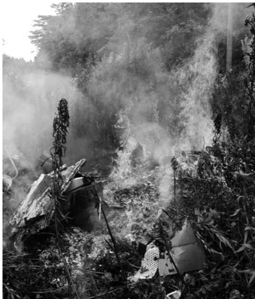
野焼きは煙や臭いなどの被害だけでなく、火事の危険も

罰金や過料があるからではなく、周囲の迷惑になる野焼きは絶対にやめ、ごみは適切に処理しましょう。