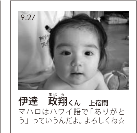
伊達 政翔くん 上宿間 マハロはハワイ語で「ありがとう」っていうんだよ。よろしくね☆