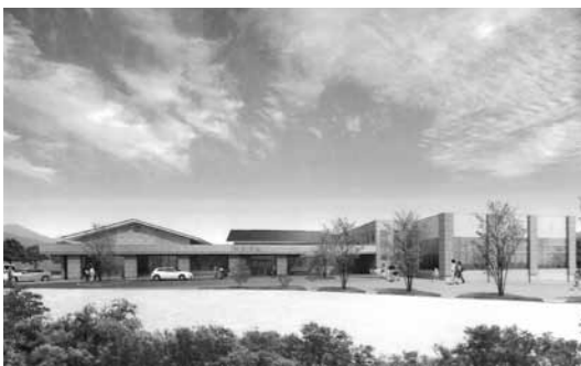
健康増進施設の完成予定図