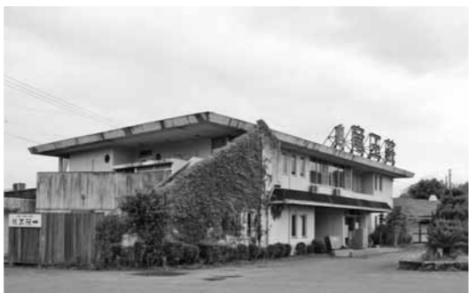
現在の龍王荘を取り壊し、新たな温浴施設を整備

※1プロポーザル公募は高度な知識や技術などが要求される業務において、事業者から技術提案書の提出を公募し、これを基に事業者を選定する方式 ※2ヴィラ棟は1戸建ての宿泊施設