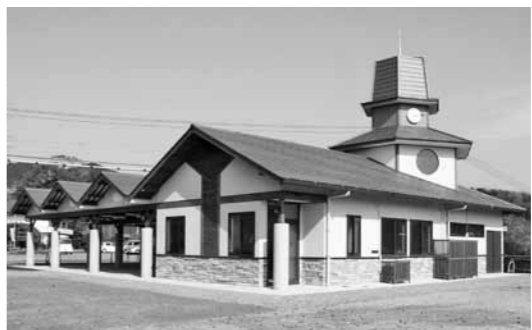
20年度に整備された直売施設の外観

そこで内子町は、平成17年1月の3町合併に伴って策定した「内子町新町建設計画」のシンボル・プロジェクトとして龍王再開発事業に取り組みむこととしました。さらに、同計画を継承し新たなまちづくりを進めるため19年9月に策定した「内子町総合計画」の中で、プロジェクト10の健康づくりプロジェクトとしても位置付けています。龍王再開発事業では「町民