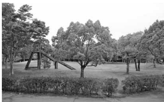
冒険広場には新しい遊具などを設置