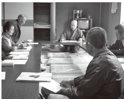
住職さんを招いて

○毎月1回の茶話会とあわせて、住職さんを招いて地域の昔話や歴史を勉強したり、季節の料理を作ってみるなどで食事をしたりと、楽しい活動をしています。