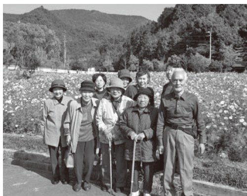
コスモス園に出かけて