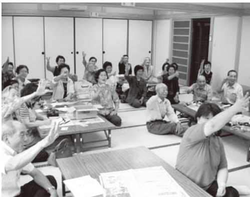
手遊びで頭の体操

○茶話会とあわせて、女性部や地域のボランティアが協力しておいしい食事を作ったり、ミニゲームなどを楽しんだり、楽しく活動しています。