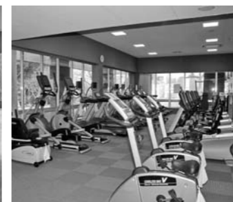
ジムには19種類34台の機器を設置。老若男女を問わず利用できます