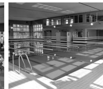
25mの温水プール。最深部は1.1m。歩行用や初心者用のコースも