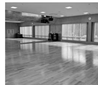
2面が鏡張りになった、広くて明るいスタジオ

同施設は、25m×6コースの屋内温水プールやトレーニングジム、ストレッチ体操やエアロビクスを行うスタジオ、浴室やサウナなどを完備。それぞれの利用者にあつた運動計画を立て、一人一人の健康づくりを支援します。また、町と連携した生活習慣病予防や介護予防のための運動教室なども開かれる予定です。 体力維持・健康増進のために、ぜひご利用ください。