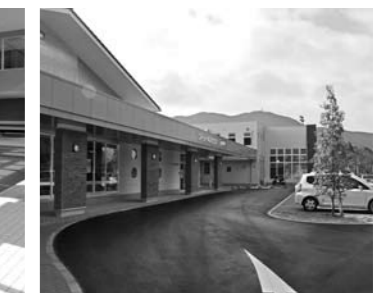
施設の外観。玄関を入るとすぐに受付があります