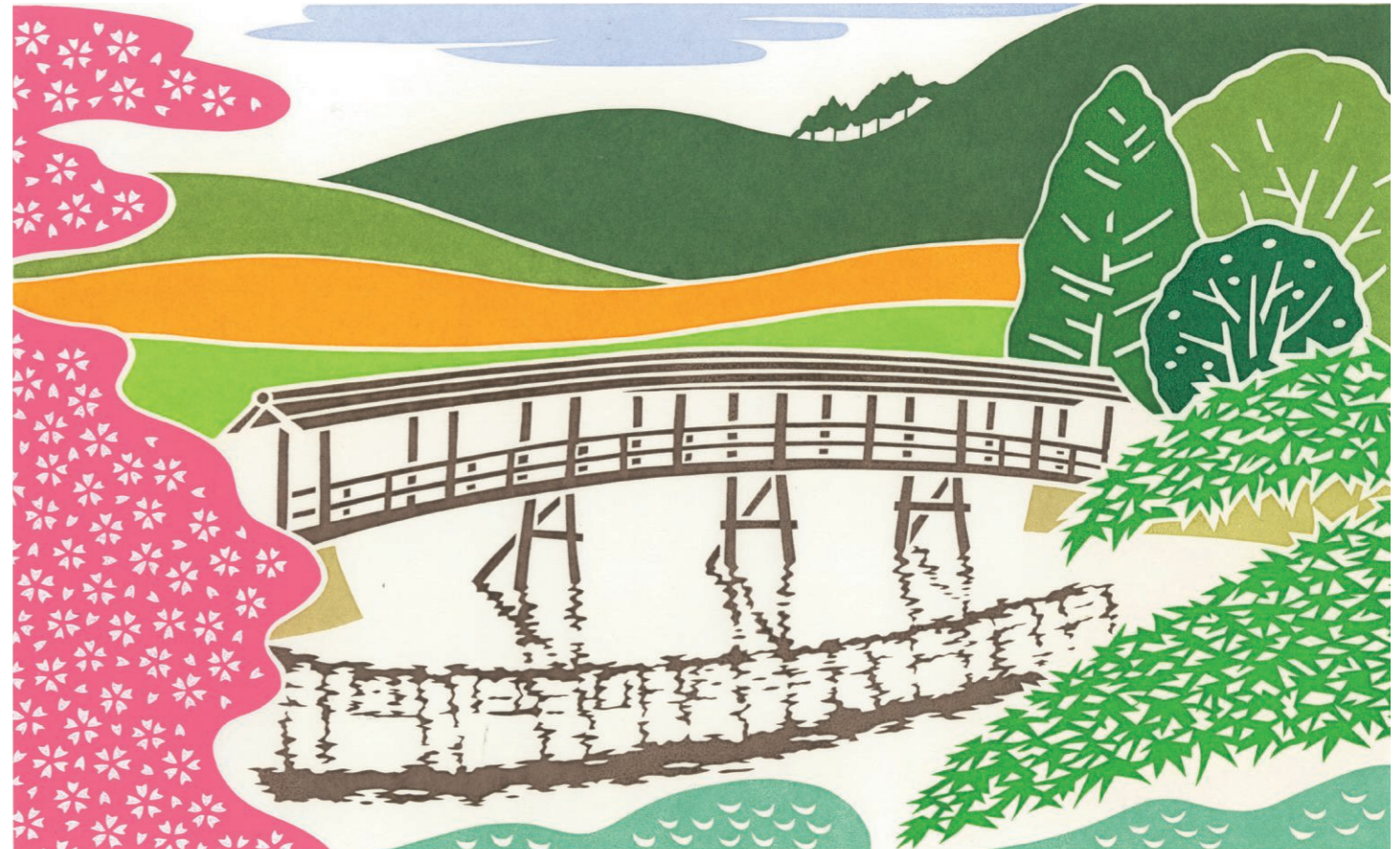
弓削神社の屋根付き橋 / 版画 山田きよ