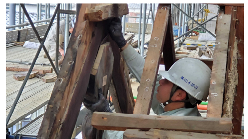
▲東櫓の懸魚解体作業の様子