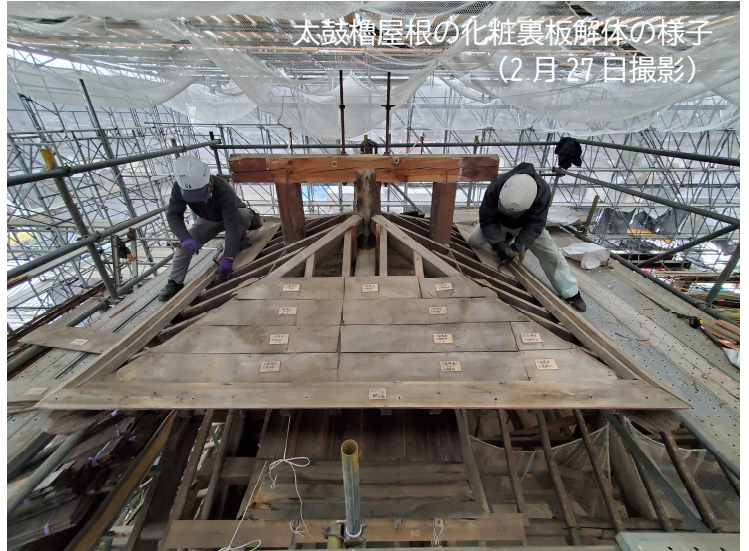
太鼓櫓屋根の化粧裏板解体の様子 (2月27日撮影)

職人さんとの会話の中で、イカと笑いあった内子座太鼓櫓の懸魚ですが、東西櫓の懸魚を含め、いつの日か内子座楽屋で展示していきたいと思えます。どうぞ期待！