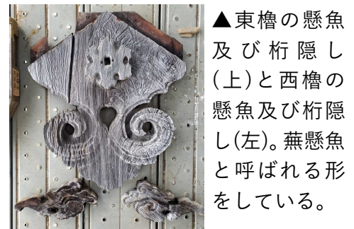
▲東櫓の懸魚及び桁隠し（上）と西櫓の懸魚及び桁隠し（左）。蕪懸魚と呼ばれる形をしている。