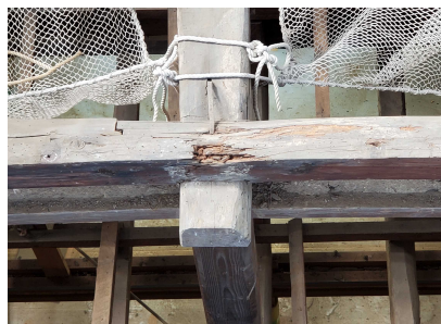
▲一部に腐食が見られる軒桁

令和8年3月2日、今年度最後の解体作業となる大屋根東面の一部の垂木が解体されました。これは、軒桁の一部に破損が見られ、その部分を修理するための解体作業です。