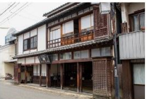
旧佐野家住宅(高いと暮らし博物館)主屋