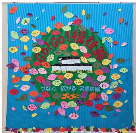
福祉館まつりメッセージボード

「うちこ福祉館」は、今年で開館五十六年目を迎えます。これから皆さんに人権のメッセージを届け、笑顔の輪を広げてゆきます。