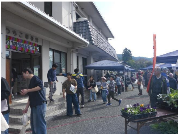
玄関前バザー会場も来場者でおお賑わい。

うどん、おにぎり、焼きそば、唐揚げなどのバザーが行われた玄関前スペースは、午前中から大賑わい。