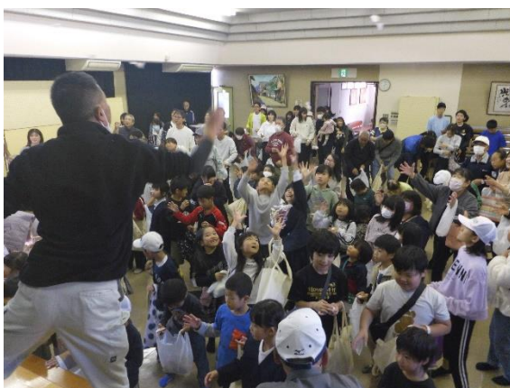
餅撒き・お菓子撒き、みんな踊って？ます。

館内では、手作りクッキーや館利用団体手作り作品販売、デコラティブペイント体験、お茶席、健康チェックコーナーが設けられました。