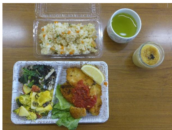
美味しく盛り付けました。いただきます。