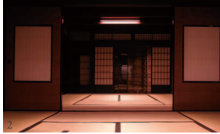
1_ 夕暮れ時の上芳我邸。格子戸がやさしく浮かび上がる 2_ 和室の明かり

3年余りにわたる保存修理工事を終えて24年4月に全面開館した木蟬資料館「上芳我邸」が、このほど(社)照明学会の「平成24年度照明普及賞」を受賞しました。 同学会は、照明技術の発展・普及のために各種研究などを行っており、昭和32年に照明普及賞を創設。毎年、その年に竣工した優れた照明施設を表彰しています。